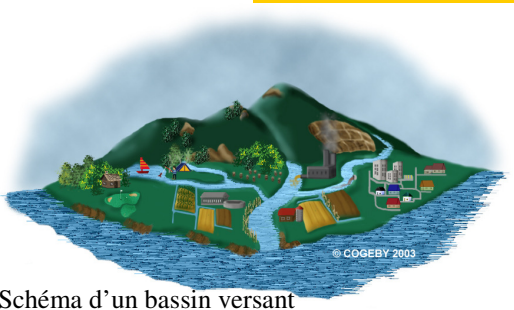
Schéma d'un bassin versant

Le phosphore favorise la croissance des algues et plantes aquatiques. Une trop grande quantité de celui-ci dans l'eau de nos lacs favorise l'apparition de fleurs d'eau de cyanobactéries et peut même mener à l'eutrophisation des lacs.